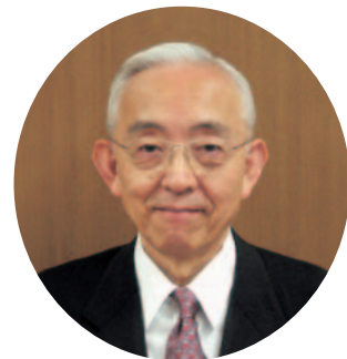
認知症介護研究・研修東京センター長 長谷川 和夫さん

認知症介護研究・研修東京センター長 長谷川 和夫さん (聖マリアンナ医科大学 名誉教授)